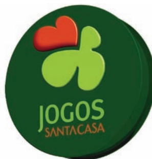
BANDEIROLA MONOFACE (MNF)

Breve Descrição: aro metálico com faces acrílicas e iluminação interior