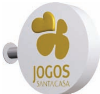
BANDEIROLA DUPLA FACE PATRIMÓNIO (SPP e SOP)

Breve Descrição: aro metálico com face acrílica e iluminação interior