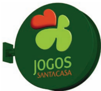
BANDEIROLA DUPLA FACE (STP)

Aplicação: perpendicular à fachada exterior do estabelecimento