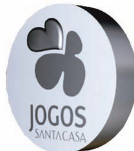
BANDEIROLA MONOFACE PATRIMÓNIO (MPP e MOP)

Breve Descrição: aro metálico com faces acrílicas, sem iluminação interior